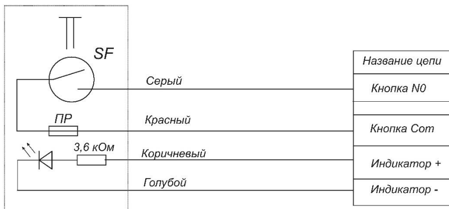
Рисунок 2 – Маркировка выводов изделия AL-BT-S02